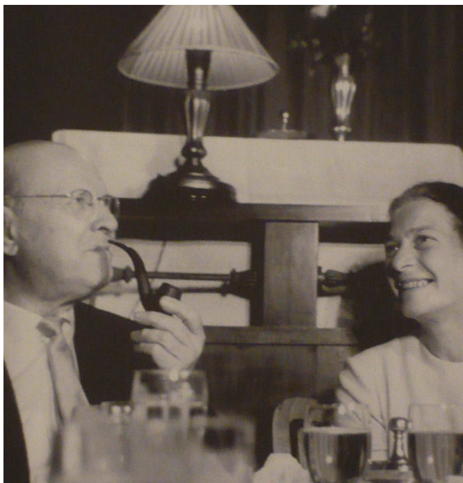
12. kép: Fischer Annie Casalsszal a Gundelben 1964-ben

1964. október 13-án Kodály meghívására és társaságában Kecskemétre készült Casals, ahol a magyar zenetanítási módszerrel szeretett volna megismerkedni, ám gyengélkedése és valószínűleg zsúfolt programja miatt végül nem került sor a kecskeméti látogatásra. 316