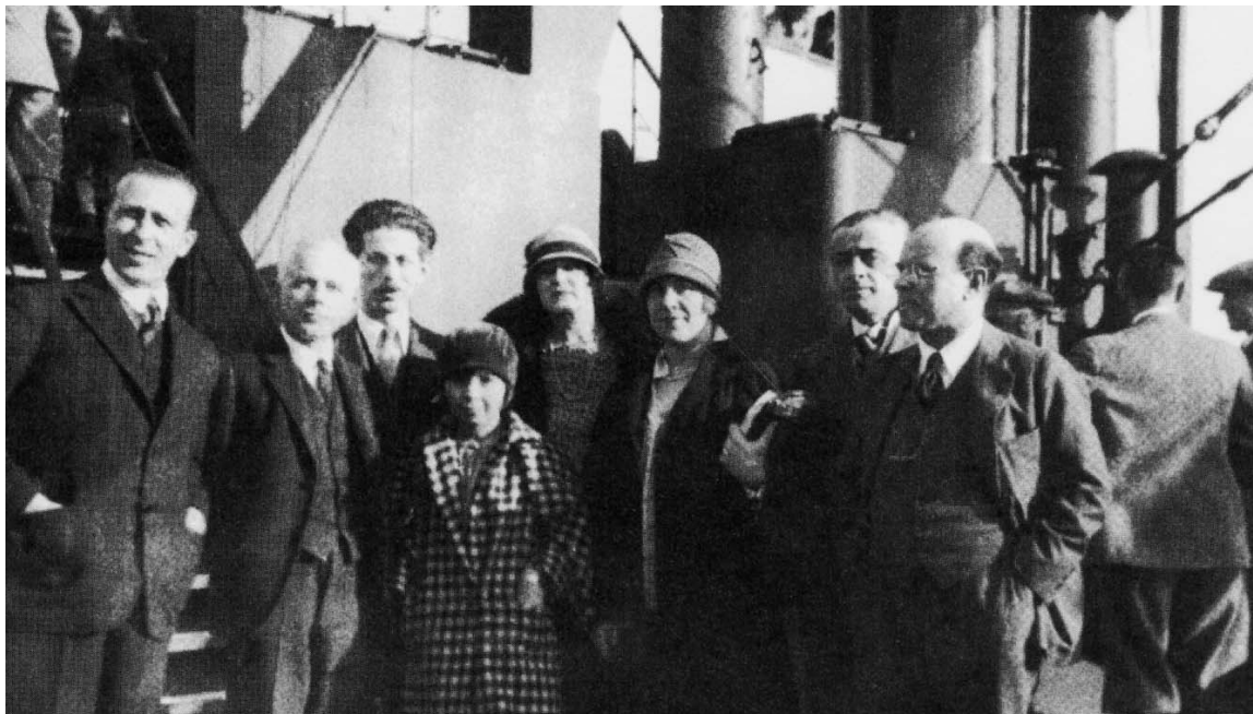
5. kép: Bartók és Casals a George Washington gőzös fedélzetén 1928-ban

meg. 180 Tudomásom szerint a jelenleg rendelkezésünkre álló egyetlen közös fényképük egy 1928. március 6-án az Európa és Amerika között közlekedő George Washington gőzös fedélzetén készült. 181 (5. kép).