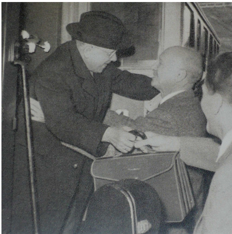
6. kép: Szigeti és Casals Zermattban 1947-ben