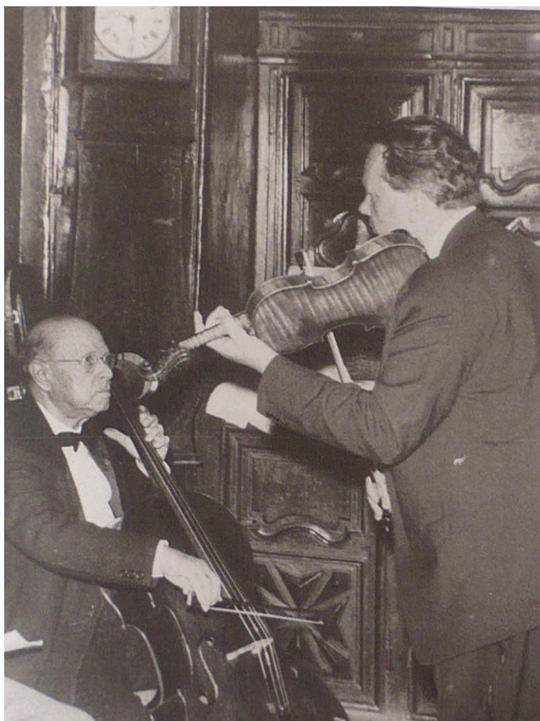
7. kép: Casals és Végh Sándor, Prades. Hangolás a sekrestyében.

Mindig vidám volt és nagyon jól tudott történeteket mesélni. Nagyon sokszor ettünk együtt valahol, Casals, zenésztársai és feleségeik. Néha olyan hangosan nevettünk, hogy az étteremben ülő emberek szinte rosszalóan fordultak felénk. Csodálatos nyári élmények voltak ezek, Casals közelében. 206