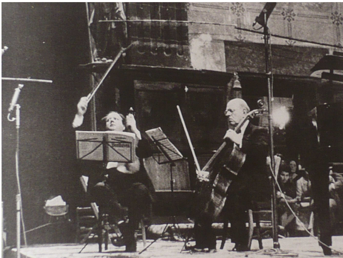
8. kép: Casals és Véghe Sándor a Prades-i Fesztiválon

Az előbb említett felvételek mellett Casals és Véghe Sándor 1958-ban a bonni Beethoven-házban felvették Beethoven op. 1-es c-moll és op. 97-es B-dúr trióját, valamint a Schubert C-dúr vonósötöst.