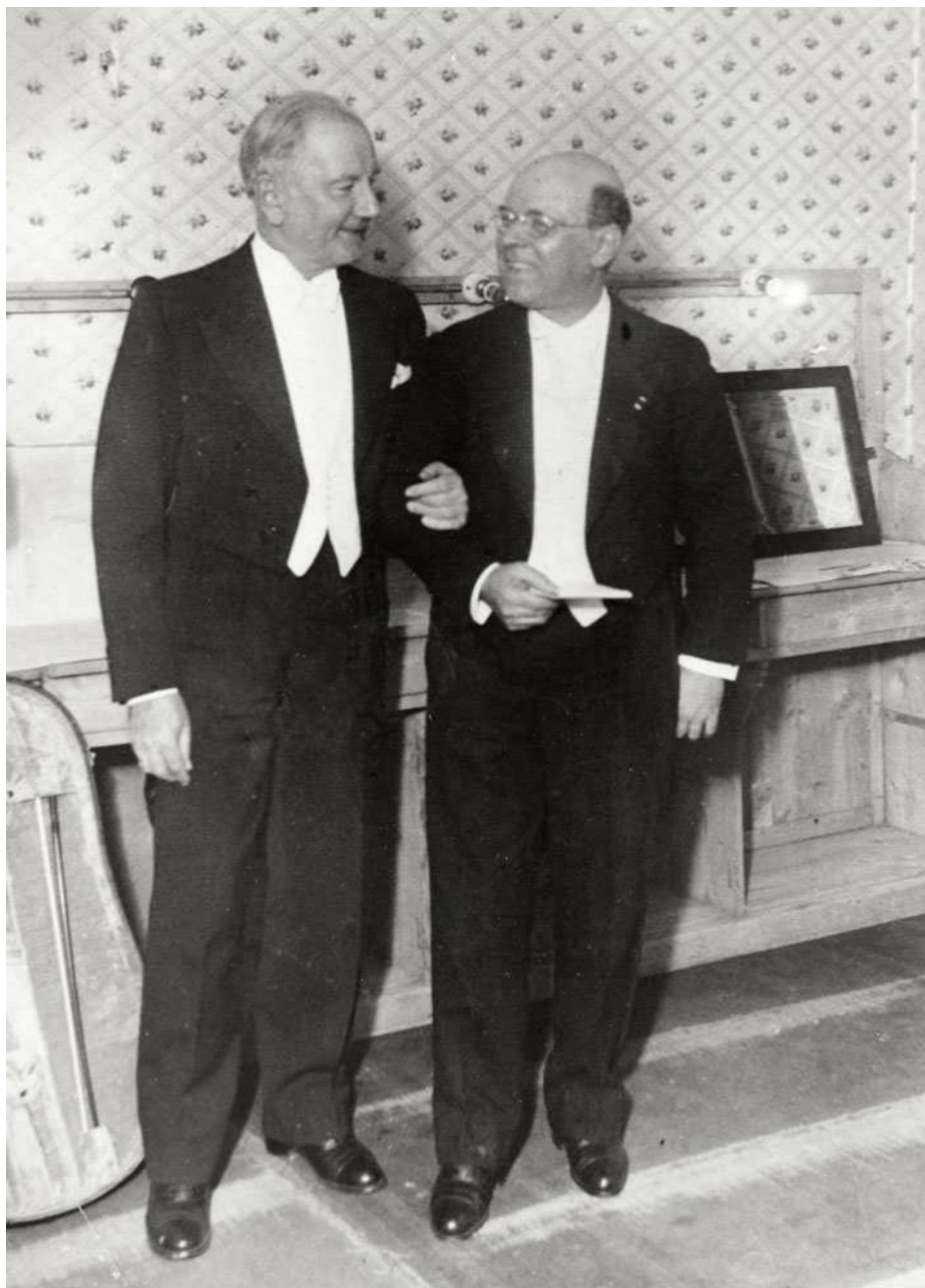
3. kép: Casals és Dohnányi (1935-36)

filharmonikus zenekarunk egy nagy rokonléleknek, a zongorán harmonikus szépség hasonló csodáit művelő Dohnányi Ernőnek vezetése alatt kísért. 153