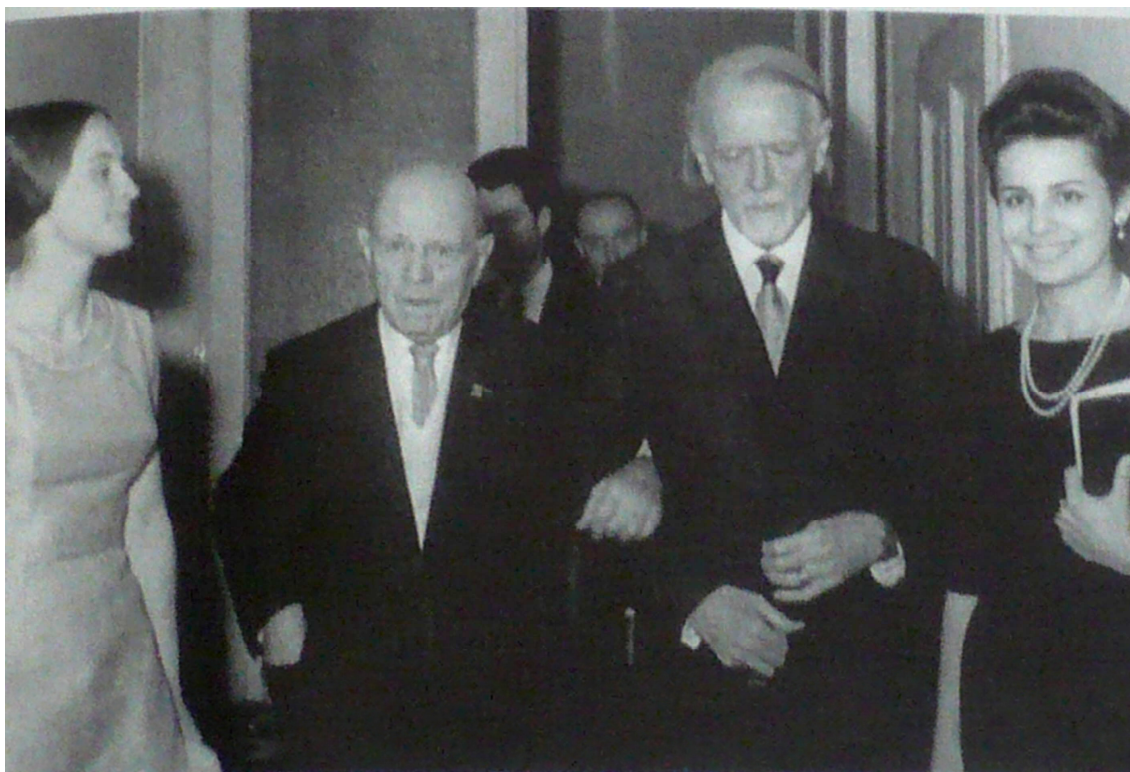
4. kép: Casals és Kodály feleségeikkel Budapesten (1964-ben) 177

később, 1965 augusztusában találkoztak – valószínűleg – utoljára, mikor Kodály egy amerikai útja során meglátogatta Casalst Marlboróban. 176